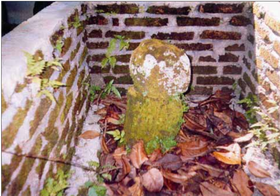
Photo-6. Batu Tunggung Ni Kuta/ Pertahanan Desa di Lokasi Awal Desa Tunggung Batu.

merupakan induk banyak pohon durian yang telah berkembang di sekitar desa dan ke desa-desa tetangga lainnya. Sebagai salah satu contoh adalah Kebun nanas yang terpadu dengan kebun durian di Sempung Lumban Sihite kurang lebih 20 km dari Sidikalang, yang telah menjadi lokasi kunjungan wisata untuk menikmati panorama persawahan dengan latar belakang Kawasan Ekosistem Leuser sambil menikmati buah Nanas (tersedia setiap saat) dan buah Durian pada musimnya. Menurut pemilik kebun bahwa bibit Tanaman Durian tersebut, berasal dari Desa Parongil sekitar 10 tahun yang lalu dan jika Desa Tunggung Batu merupakan desa tertua dan pohon durian yang terdapat disana sebagai durian yang sudah sangat tua juga maka tidak tertutup kemungkinan bahwa Durian di Sempung Lumban Sihite nenek moyangnya adalah dari pohon durian di Desa Tunggung Batu juga.