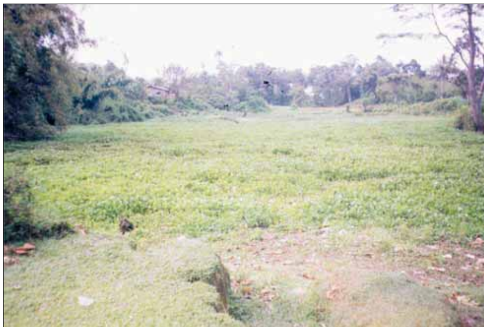
Photo-5. Panorama Danau Kempawa yg telah ditutupi Enceng Gondok. Tabel-3. Analisa SWOT Objek Ekowisata di Kawasan Tanah Pinem