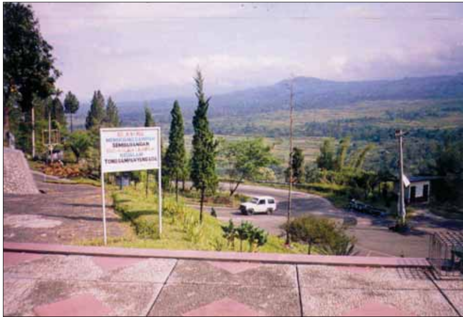
Photo-4. Pemandangan Indah kearah Desa Sumbul dari Taman Wisata Iman. Tabel-2. Analisa SWOT objek ekowisata Kawasan Sidikalang

Taman wisata iman di Letter S merupakan cerminan kerukunan dan ketaatan masyarakat dairi memeluk agamanya, menjadai daya tarik yang sangat kuat bagi wisatawan untuk berkunjung ke kawasan wisata ini. Jika dibandingkan dengan Kabupaten lain di Sumatera Utara, maka hanya di Kabupaten Dairi diperoleh pendekatan cerminan seperti ini.