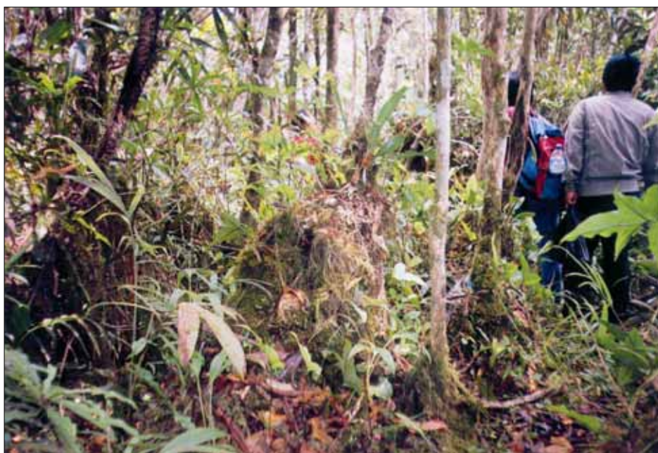
Photo-3. Tanaman Anggrek yang memukau banyak dijumpai desiktar Danau Sicike-cike, sangat potensial menjadi lokasi konservasi Anggrek