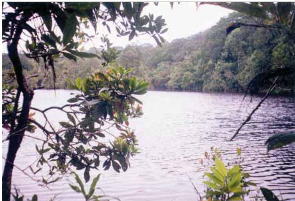
Photo-2. Keindahan Danau Sicike-cike dengan kesan alam asri.