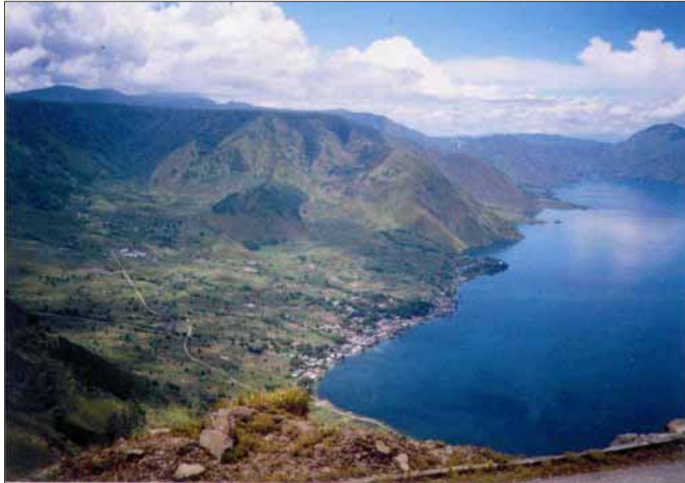
Photo-1. Pemandangan Indah kearah Desa Silalahi dan Danau Toba serta Perbukitan disekitarnya dari Dolok Simaddar.

Tidak jauh dari lokasi Lae Pandom wisatawan dapat mengunjungi Dolok Simaddar, dimana dari lokasi ini Danau Toba terlihat lebih jelas dan termasuk hutan yang disebelahnya, suatu pemandangan panorama yang sangat indah.